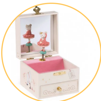
Une boîte à musique