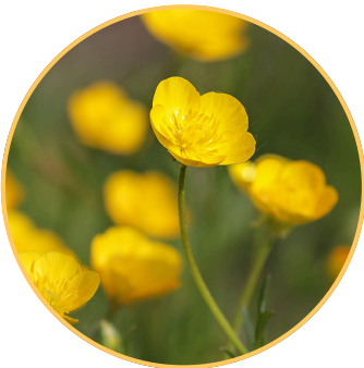
Un bouton d'or