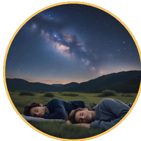
Dormir à la belle étoile