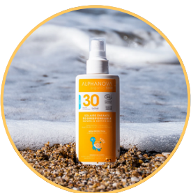
De la crème solaire