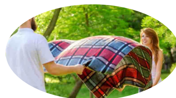
Déplier (une nappe)