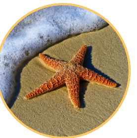
Une étoile de mer