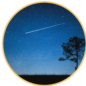
Une étoile filante