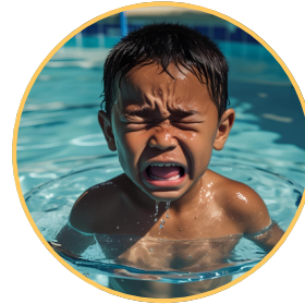
Boire la tasse