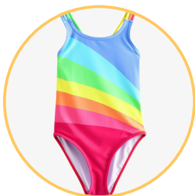
Un maillot de bain